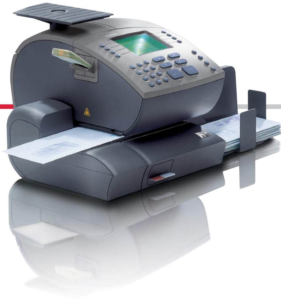
Frankiermaschine ultimail 45