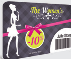
GESCHENK- UND ANGEBOTSKARTEN