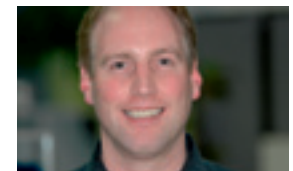
Stefan Spahn Produktion