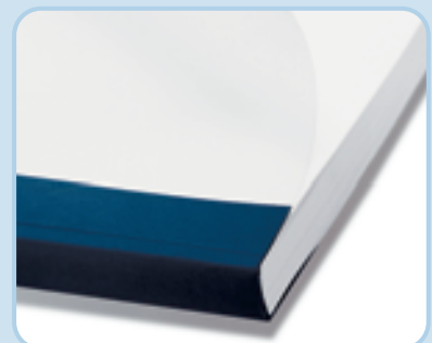
Gebundene Bindomatic-Mappe mit akkurat ausgerichtetem Papier und sauberer Rückenkontur