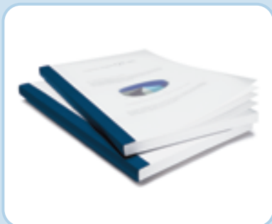
Standardmappen – hier in der Ausführung Aquarelle