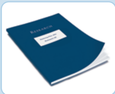
Individuell gestaltete Mappe – Design nach Ihren Vorstellungen