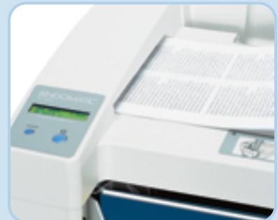
Im Size-Selector wird die passende Mappengröße bestimmt