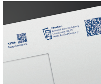
Neue Freiheiten bei den Klischees