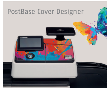
Gestalten Sie Ihre persönliche PostBase unter: www.postbasedesign.de

One Button Only. Tastenfeld war gestern. Einmal eingeschaltet, lässt sich die PostBase 30 kinderleicht über ein 4,3-Zoll großes, schwenkbare Farb-Touchdisplay bedienen. Die Erstinstallation führt die PostBase eigenständig aus. Eine LAN-Schnittstelle gestattet blitzschnelle Software-Updates, Portotarife und neue Werbeklischees online. Einfach für den Erstanwender wie auch für wechselnde Bediener. Neben dem Easy-to-Use-Konzept ist es vor allem das niedrigste Betriebsgeräusch seiner Klasse, das durch eine ruhige Arbeitsplatzumgebung Leistung fördert und Stress mindert.