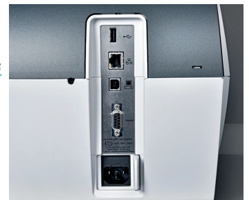
Plug & play: 2 USB- und ein Highspeed-LAN-Anschluss sind bereits vorhanden