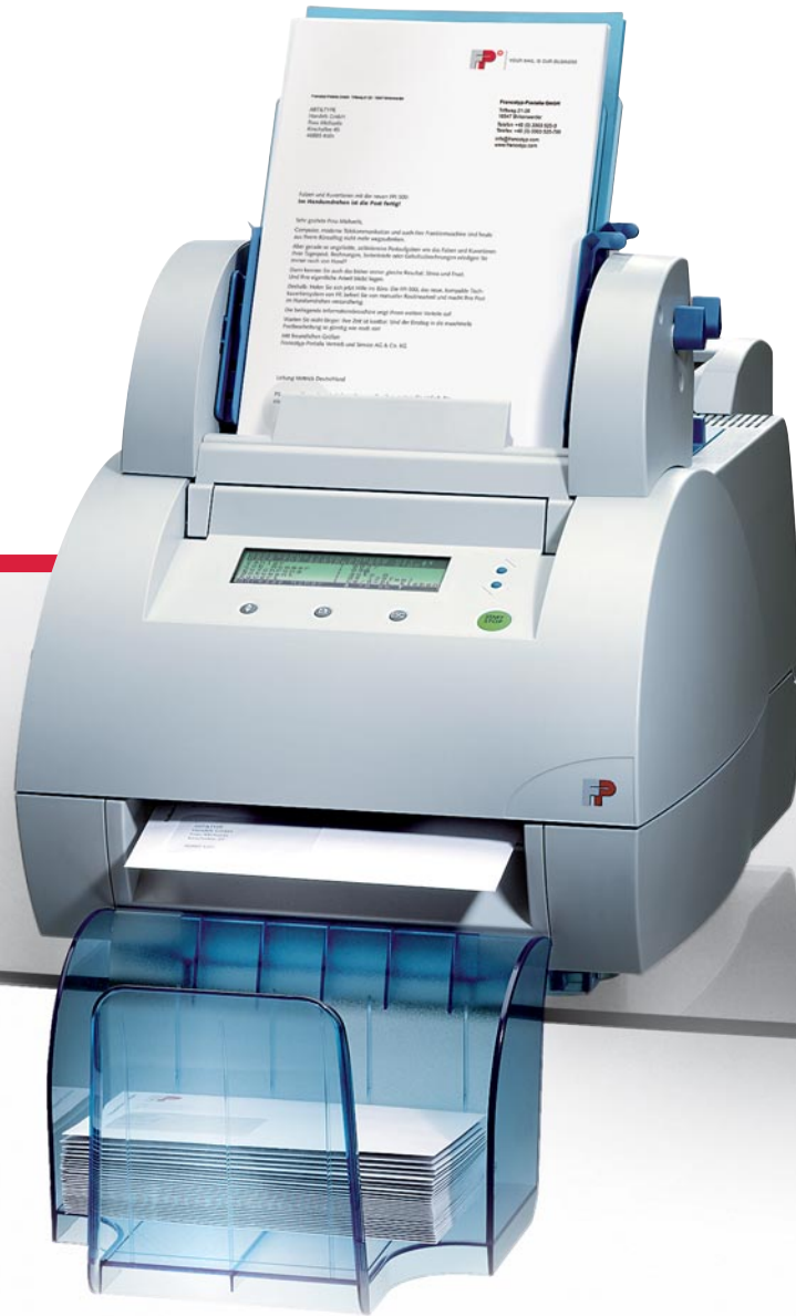
Tischkuvertiersystem FPI 500

Falzen, Kuvertieren, Schließen – 10x schneller als manuell.